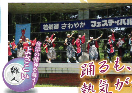
郷土の精神を舞う