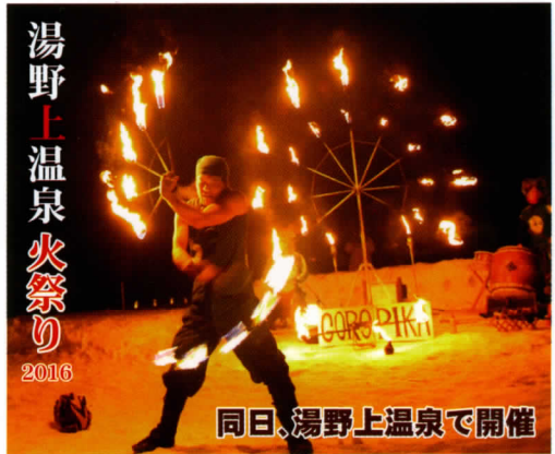
同日、湯野上温泉で開催

当日、中止のお知らせは「下郷町観光協会Twitter」または、「下郷町役場のホームページ」をご覧ください。